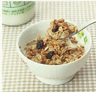
産直びん牛乳やヨーグルトをかけて～