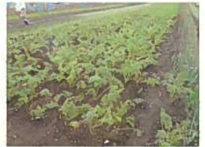
人参畑 順調に生育中！

次に、芋ほりの手伝い。土の中から丁寧に芋を掘り出し、並べてつるを切る。りっばなお芋がたくさん収穫できました。「紅はるか」は収穫後、40~50日経つと、でんぷんが糖分に変わりおいしくなるそうです。