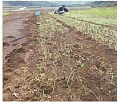
玉ねぎ畑 草とり後の様子