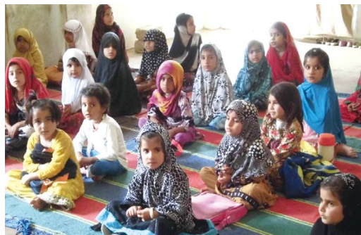
パキスタンカラチ市にある無料の学校。アル・カイル アカデミー の様子

パキスタンへは、年に3回、1回25tの衣類を送っています。現地の古着商に販売され、1回に送る衣類の利益は、約200人の子どもが1年間通えるくらいの学校の運営費になります。