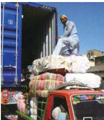
パキスタンでの荷おろし作業の様子

パキスタンへは、年に3回、1回25tの衣類を送っています。現地の古着商に販売され、1回に送る衣類の利益は、約200人の子どもが1年間通えるくらいの学校の運営費になります。