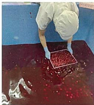
槽から小梅を取り上げる作業は とても大変そうでした。

10月8日(木)店舗委員会と日田センター運営委員会の6人で日田市の大分大山町農業協同組合を訪問し小梅干(七折)の製造工程を確認してきました。